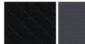
N-CONNECTA Sellerie Tissu Noir avec surpiqures grises