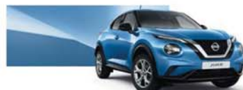
Bleu Topaze (MS) - RCA