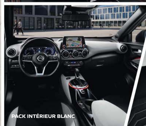
PACK INTÉRIEUR BLANC