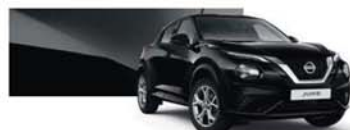
Noir Métallisé (M) - Z11