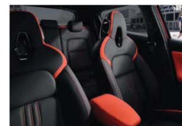
N-DESIGN PACK INTÉRIEUR ORANGE Sellerie Perso Orange : sellerie Cuir/TEP*