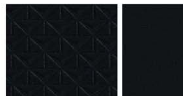
VISIA & ACENTA Sellerie Tissu Noir