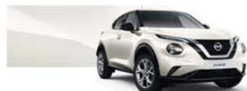
Blanc Lunaire (MS) - QAB