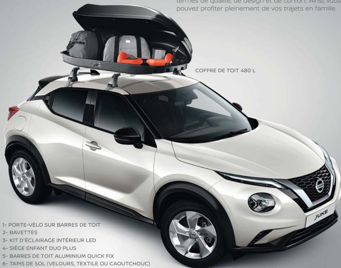
COFFRE DE TOIT 480 L

Comme votre Nissan JUKE, la gamme d'accessoires Nissan est conçue pour répondre à vos attentes en termes de qualité, de design et de confort. Ainsi, vous pouvez profiter pleinement de vos trajets en famille.