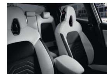
N-DESIGN PACK INTÉRIEUR BLANC Sellerie Perso Blanc : sellerie mixte TEP*/Tissu