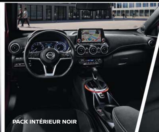
PACK INTÉRIEUR NOIR

PERSONNALISATION EXTÉRIEURE* Exprimez votre style avec les 11 combinaisons de couleurs de carrosserie bi-ton à votre disposition.