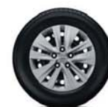
Acier 16" (avec enjoliveurs)