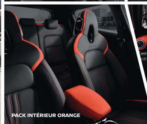
PACK INTÉRIEUR ORANGE