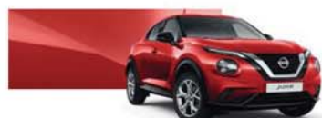
Rouge Toscane (O) - Z10

MS = Métallisée spéciale M = Métallisée O = Opaque