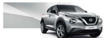
Gris Perle (M) - KYO