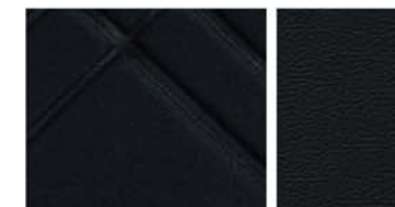
TEKNA Sellerie mixte TEP*/Tissu