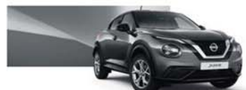
Gris Squalé (M) - KAD