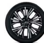
Alliage 19" AKARI