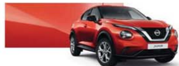
Rouge Fuji (MS) - NBV