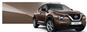
Bronze Intense (M) - CAN