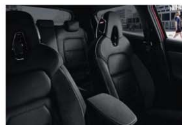
N-DESIGN PACK INTÉRIEUR NOIR Sellerie Perso Noir : sellerie Cuir/Alcantara®