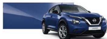
Bleu Indigo (M) - RBN