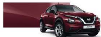
Rouge Passion (MS) - NBQ